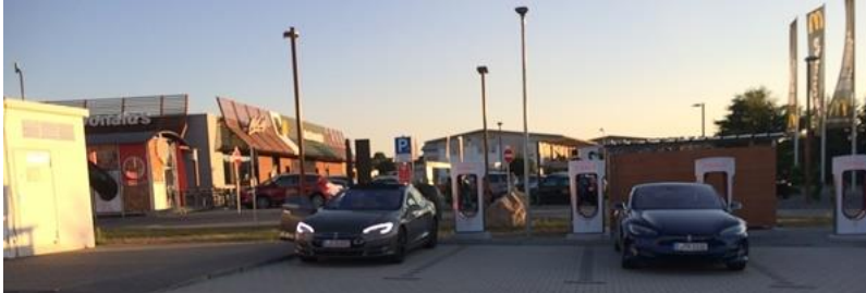
Unser Tesla (links) am Supercharger

Unser Rückweg führte uns am Vierwaldstädter See in der Schweiz vorbei, wo sich wieder ein Supercharger befand. Fast zuhause in Pfalzgrafenweiler angekommen, luden wir den Tesla am Supercharger in Sulz-Vöhringen noch einmal voll.